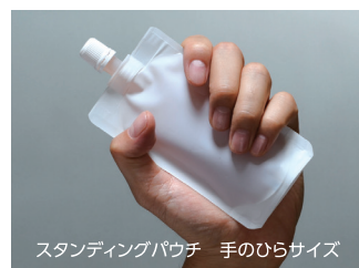
スタンディングパウチ 手のひらサイズ