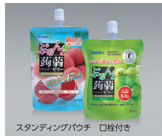
スタンディングパウチ 口栓付き

少ない設置面積で、使い勝手の良い口栓付き袋を製袋・充填包装します。口栓の形状は、充填物に合わせて各種選択できます。オプションでスライサーも取り付け可能です。